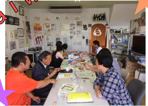
みなスマの様子 (Egao 家で開催)